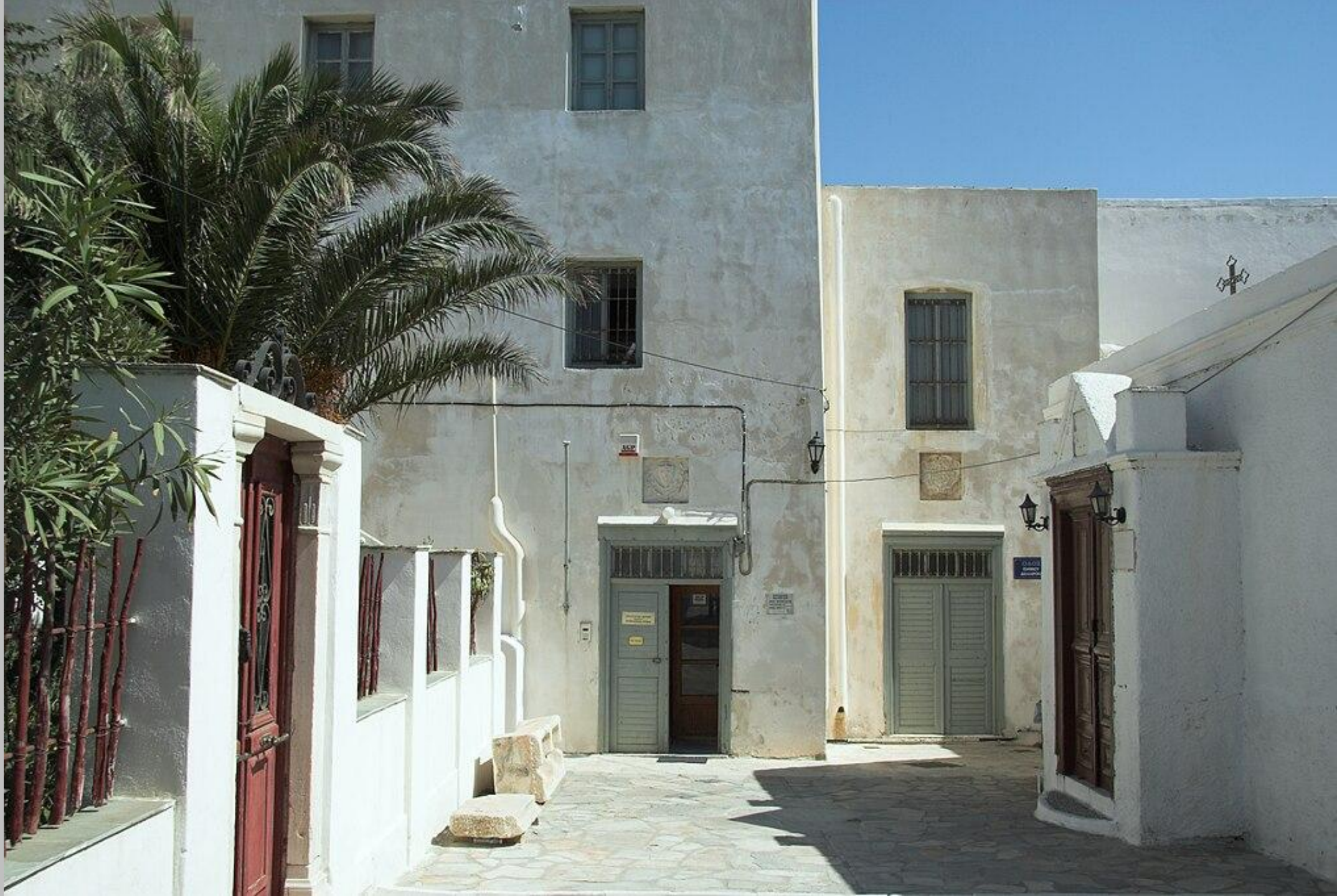
Archeologické muzeum na Naxu